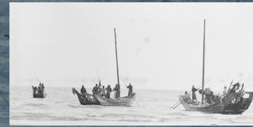
前往東引捕黃魚的帆船 | 1956年

1960年代黃魚捕撈漸趨規模化，並在70年代達到全盛期，南北竿、莒光紛紛組織船隊來東引補黃魚。80年代黃魚數量急速衰退，產業逐漸沒落。黃魚的消失多半推論是過漁濫捕加上海洋環境改變，而因時間恰為中柱堤興建前後，不少當地人認為是堤坡的興建影響水流變化而致。